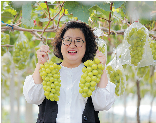
《幸福劳动者》组照选登