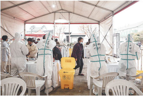
《核检》组照选登