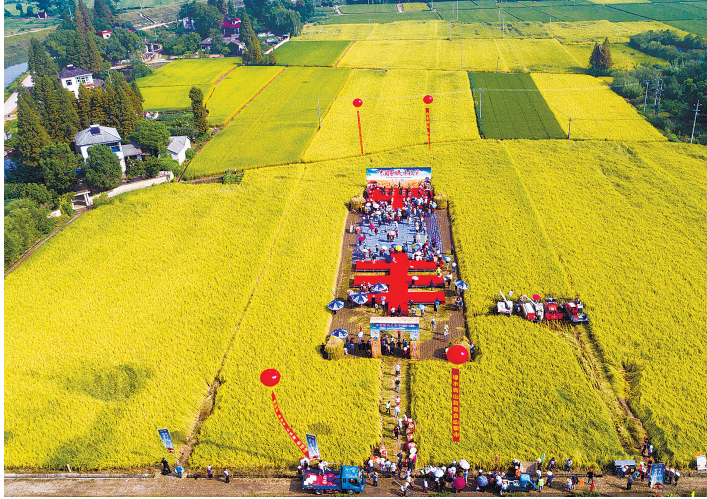
《首个农民丰收节》组照选登