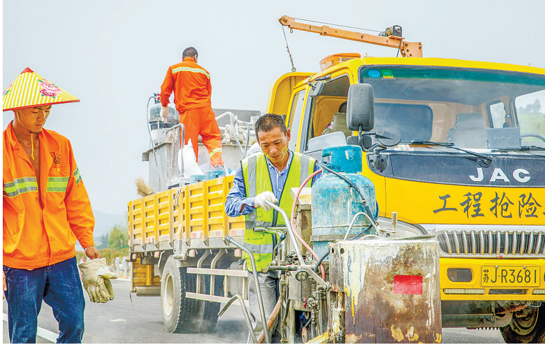
《高速公路施工》组照选登