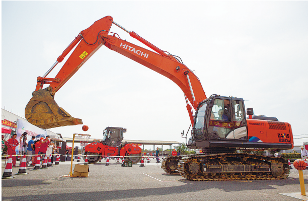
《技能比武》组照选登

主办方希望通过这次展览,吸引更多的职工喜爱书画、摄影,加入到职工文化艺术爱好者队伍中来,从生活共富走向精神共富,让生态绿、党建红的色彩在时代画卷上熠熠生辉,用世界通用的艺术语言,打造安吉生活最美名片。