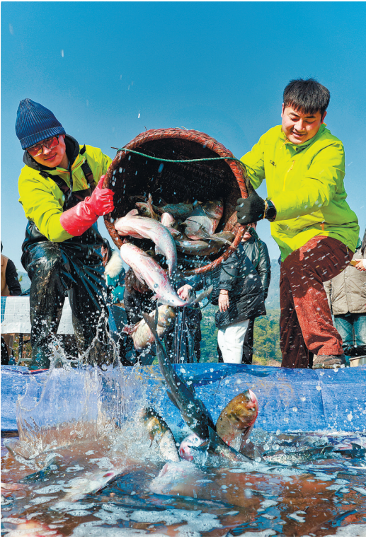
《鱼贯而入》