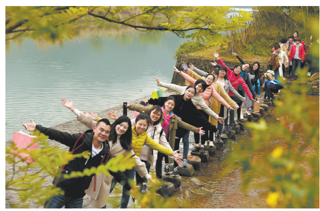
《职工疗休养,我与春天有个约会》