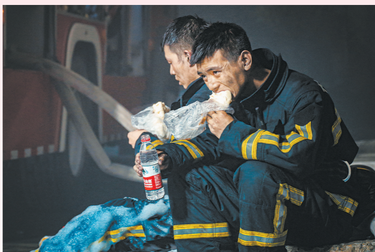
《烈火青春消防魂》二