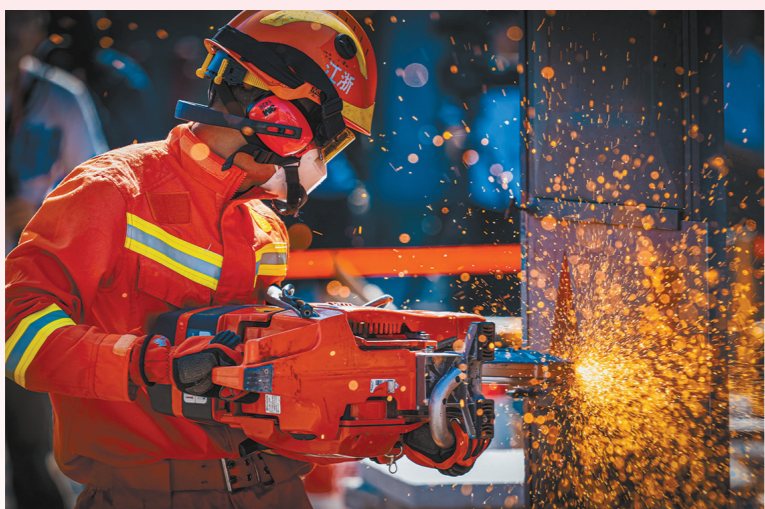
《烈火青春消防魂》一 通讯员陈永杰 摄