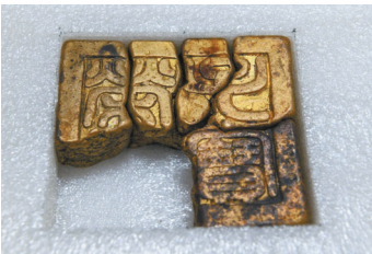
发掘出水的“荣世子宝”金印。

其中,发掘出水的“荣世子宝”金印为明代荣王世子所有,是明代册封制度的又一重要物证;“永昌督理之印”银印与2015年公安部门追缴回的“永昌大元帅印”金印的风格相似、铸造时间相同,推测为李自成赐予张献忠的军队,是研究明末清初政治历史格局的珍贵材料;“钦赐崇德书院”鎏金铜印为明代皇家书院所有,对明代文化教育的研究非常重要;箭镞、火铳和铅弹等大量明代兵器的发现,反映了“江口之