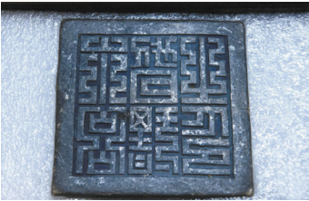
“永昌督理之印”银印。