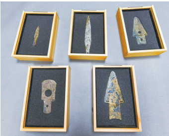
发掘出水的青铜兵器。