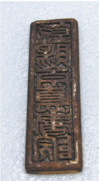
“钦赐崇德书院”鎏金铜印。

救和保护珍贵文物、寻找古代战场遗迹、确认遗址边界为主要目的,运用磁法、电法和探地雷达等地球物理探测手段确定发掘区域,在发掘过程中采用三维扫描等技术记录和提取出土文物信息,并通过考古工作平台对相关数据进行管理,保证了本次考古工作科学有效进行。