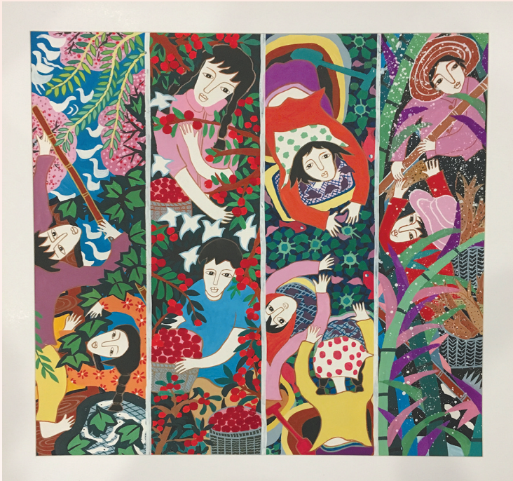
《湖水清 杨梅红》(农民画) 朱利昀