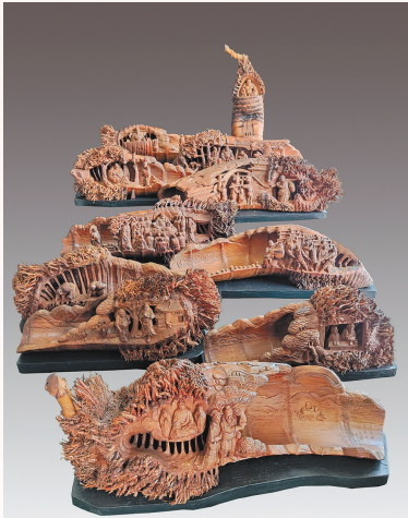
《布袋和尚传说》系列(竹根雕) 王全海