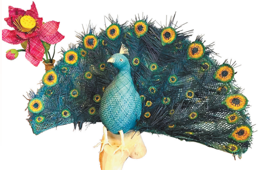
《孔雀展屏》(草编) 冯丽萍