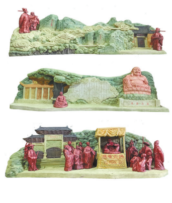
《应梦名山》(泥塑) 张龙杰