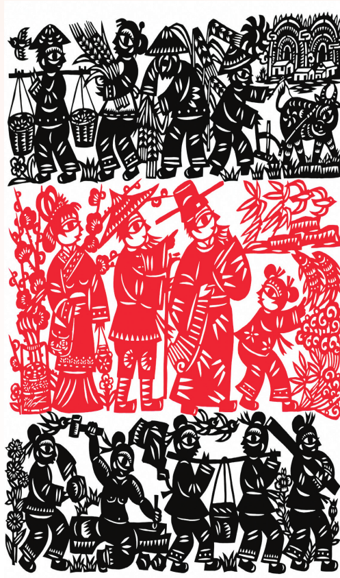
《宋韵雨存-王安石治鄞》(剪纸) 何贤顺