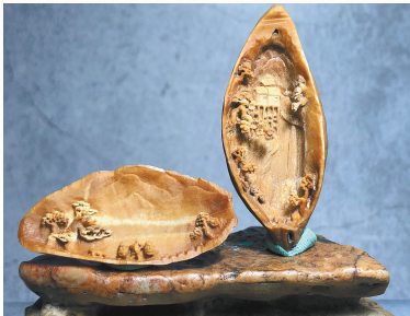
《山里人家》(核雕) 林军辉