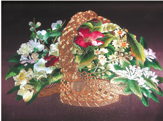
《春来(谐篮)春好》(金银彩绣) 袁群珠等