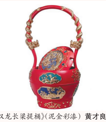
《双龙长梁提桶》(泥金彩漆) 黄才良