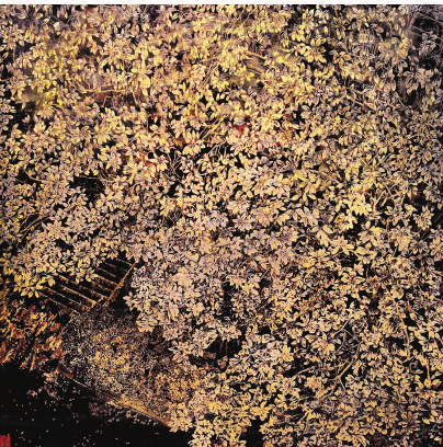
《校园一隅》(漆画) 毛伟峰、谢比丽