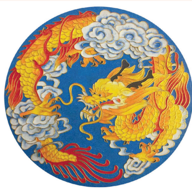
《我们都是龙的传人》(掐丝珐琅) 余朝霞