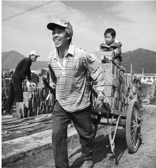
《砖窑工的幸福》