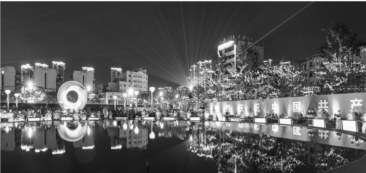
《东门广场夜景》