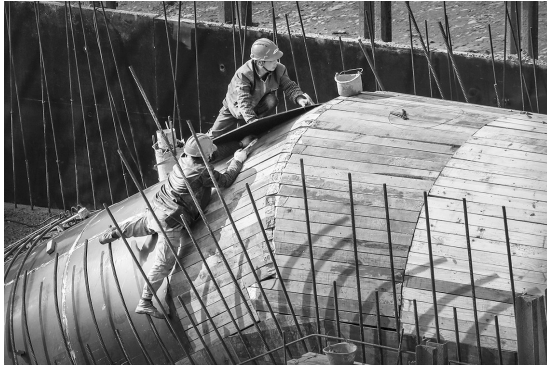
《葛岙水库建设者》张杰 摄