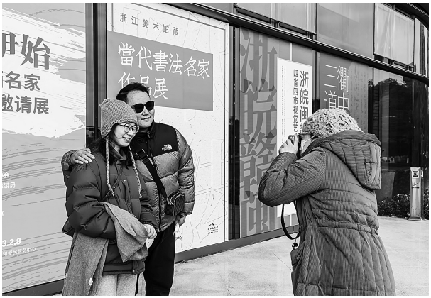
近日,位于衢州智慧新城艺术中心D座的衢州市文化馆新馆开馆。文化馆举办了“2023去遇见”活动,由工作人员免费为市民拍照,并将拍照交流过程用手写日记的形式记录下来。