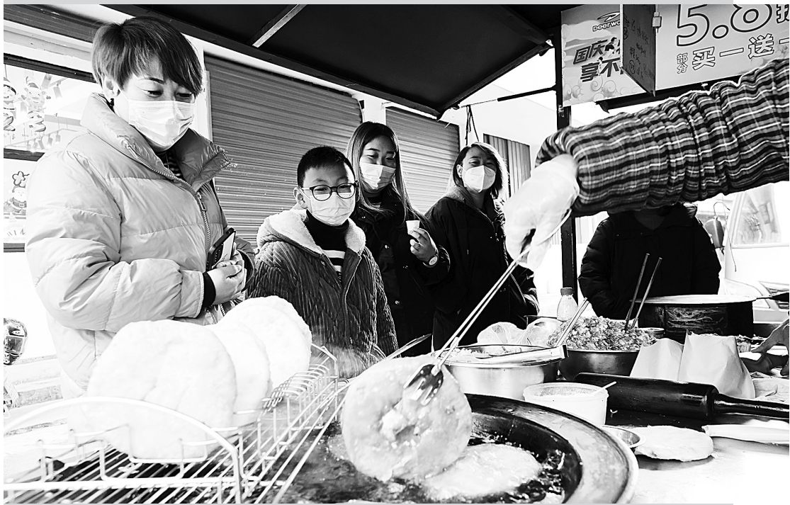
近日,潮州市德清县乾元镇余不弄、梅花糕等冒着浓浓的“烟火气”,尤为吸引丁家弄等景区,游客纷至沓来,享受元旦假期欢乐时光。现做的传统小吃大火烧、