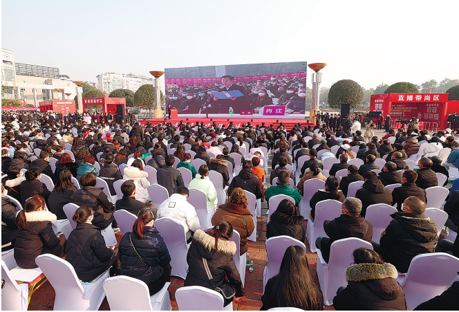
在四川广安主会场, 视频连线各地分会场的专场招聘活动。

本报讯 记者羊荣江报道 记者从省人社厅获悉, 为解决企业用工保障、稳定企业生产经营, 节前我省采取各种措施把员工留住、稳住, 提前启动东西部劳务协作招聘活动; 节后全省各地上下联动、纷纷出动, 把招聘接返员工作为当前最重要的工作。