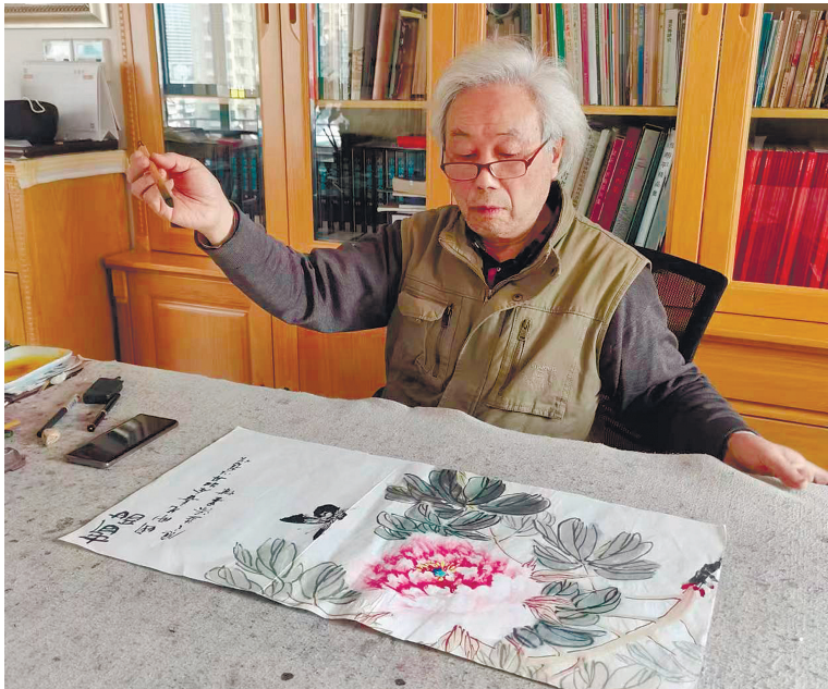
徐家昌先生创作中。

谢刚报道 在中国花鸟画界,中国美术学院教授、博士研究生导师徐家昌先生有很高的造诣,出版作品有《徐家昌画集》《花鸟画技法》《中国花鸟画临本丛书》等多种画册和技法丛书,作品编入《中国当代艺术家名人录》《中国当代艺术家图库》等,其作品还被多家博物馆、艺术馆收藏。