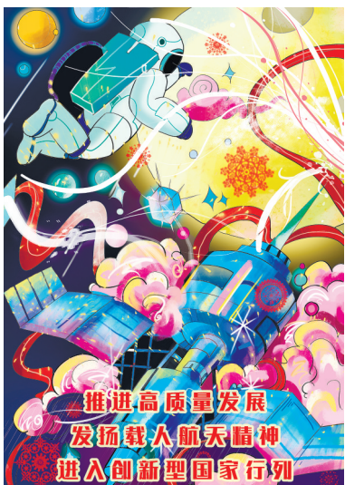
《航天筑梦》 甄梓琪 绘