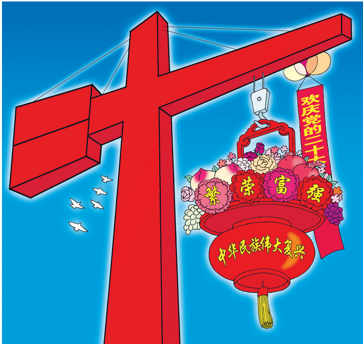
《铁肩担重任,明朝更辉煌》 王祖和 绘