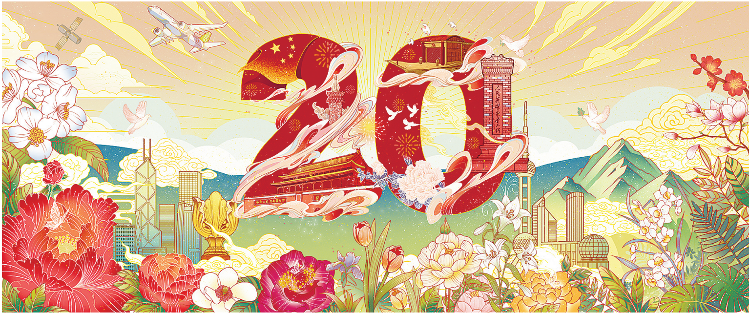
《奋进新征程》 张天伦 绘