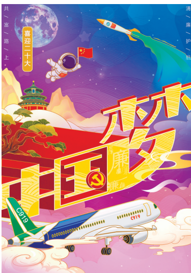
《我的中国梦》 朱飞舟 绘