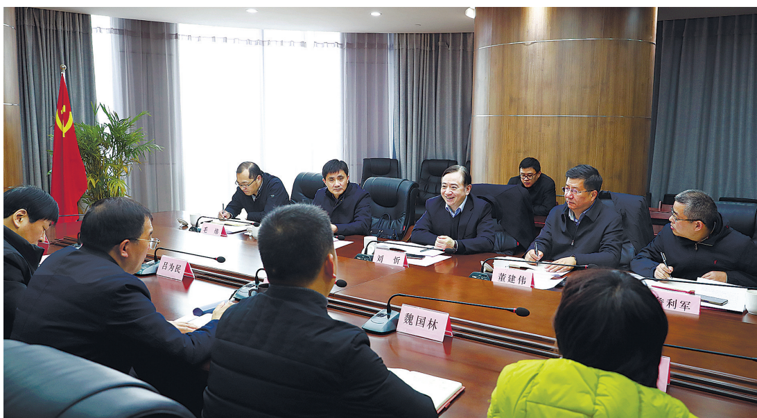
2月22日上午,刘忻走访省邮政管理局,就新就业形态劳动者工会工作情况开展调研。

我省是互联网大省,新业态、新平台蓬勃发展,快递员、外卖配送员、网约车司机等新就业形态劳动者大量涌现。在我省,就有包括快递员在内的邮政快递从业人员