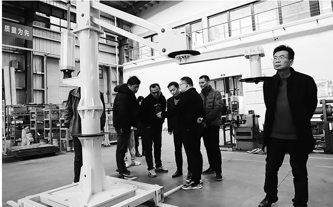
浙江自动化学会组织高校负责人与企业进行校企对接。

为提升智能制造产业高质量发展,温岭市科学技术协会、松门镇人民政府联合召开校、企座谈会,就下一步加强本土自动化企业与院校的合作进行了深入研究,决定在松门设立浙江自动化学会温岭服务部,进一步加强政府、企业、院校的对接。