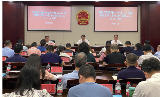
新时代鹿城产业工人队伍建设改革工作协调小组第三次(扩大)会议

工作者)2名,培育省市级工匠62人,创成省市级工人先锋号40家,打造市区级创新工作室32家。开展劳模工匠沙龙、“技协帮”志愿者下基层服务活动156场,惠及职工3.22万人次。名师带高徒形成长效机制,签订师徒协议133对,开展活动126场,进一步发挥示范引领作用。