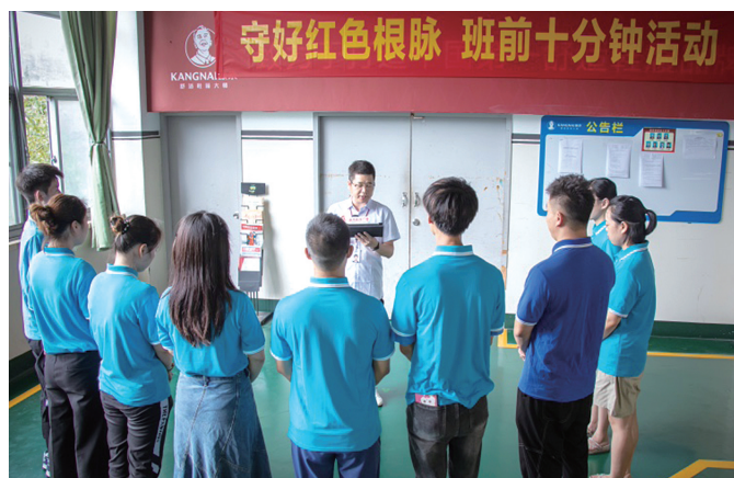
“守好红色根脉·班前十分钟活动”

列活动1.2万余场,惠及职工61万人次,广大职工理想信念坚定、思想根基牢固、奋斗共识凝聚。深化双百引领,承办全省基层群众性职工文体活动经验推广现场会、全省职工象棋大赛、全市职工运动会等,积极培育职工文体团队,以点带面推动基层职工文体活动蓬勃发展。