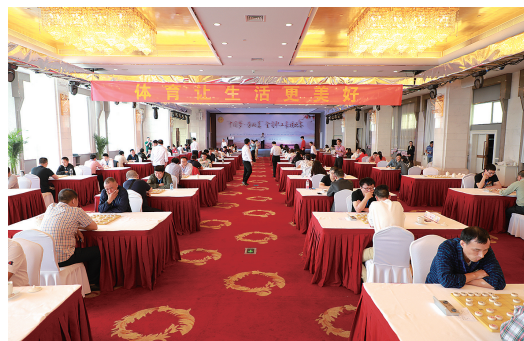
承办“中国梦·劳动美”全省职工象棋比赛