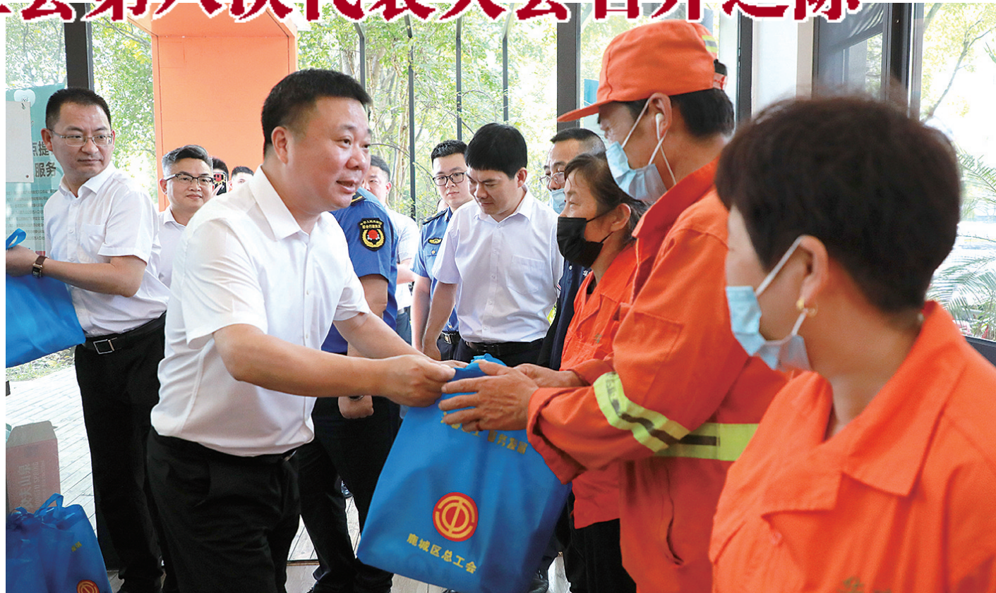
区委书记白洪楞慰问一线职工

连续五年在区直单位和全市工会系统考核中荣获先进单位,连续四年在万人评议作风效能建设中荣获满意单位,荣膺省市级荣誉39项,承办省市级会议(比赛)147项,在9个省市级会议上作典型发言,12项工作得到各级党委和上级工会的肯定……一项项殊荣记录着鹿城工会忠诚党的事业、竭诚服务职工的生动实践。