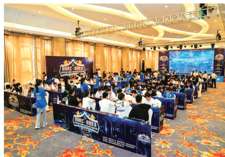
承办全市职工电子竞技比赛

困解困成果,唱响帮扶“四季歌”,发放帮扶资金205.8万元。构筑职工第二道医疗防线,全区45.8万人次参保职工医疗互助保障,5090人次获赠服务,劳动者驿站、妈咪暖心小屋、红娘工作室、爱心托班等实事项目不断提升职工获得感和幸福感受。