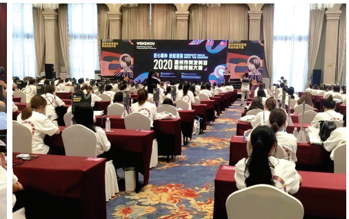
承办温州市美容美发职业技能大赛