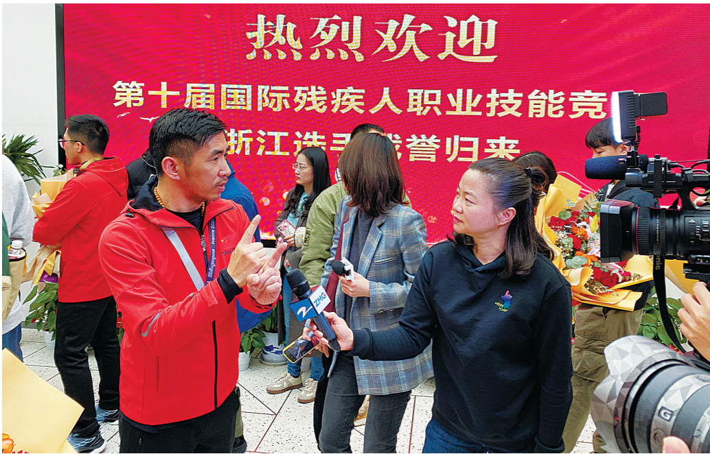
昨晚,在省残疾人之家,获奖选手们正在用手语向记者分享自己的故事。

本报讯 第十届国际残疾人职业技能竞赛于当地时间25日晚在法国梅斯落幕,来自中国代表团的29