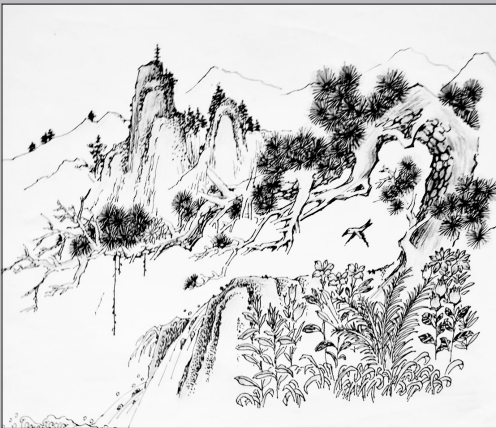
《迎客之松》 沈光祖 绘

一段感人的故事 从亲人悲切的眼神出发 在多少个嚤嚤而泣的夜晚 在阴雨绵绵的情怀中 让朦胧的月光开启潮汐 在渐行渐远的旅途漾起涟漪