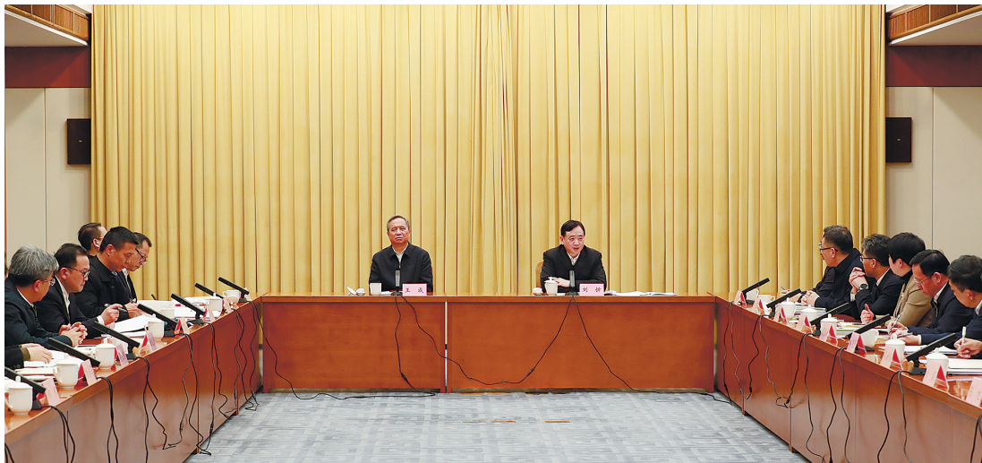
3月31日下午, 浙江省推行厂务公开工作领导小组第二次会议召开。