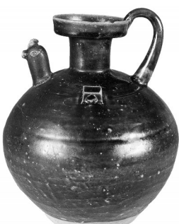
东晋德清窑黑釉鸡首壶