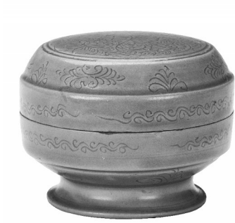
五代越窑青瓷刻划花卉纹盖盒