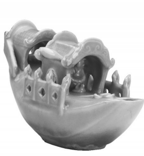
元龙泉窑青釉鱼形砚滴