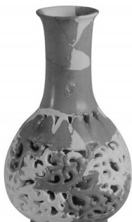
南宋官窑镂空花瓶