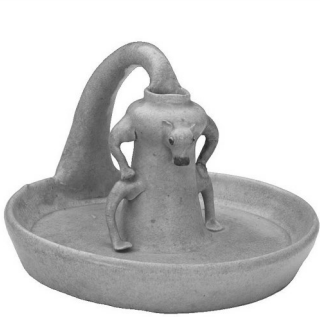
东晋瓯窑青釉点彩牛形灯盏