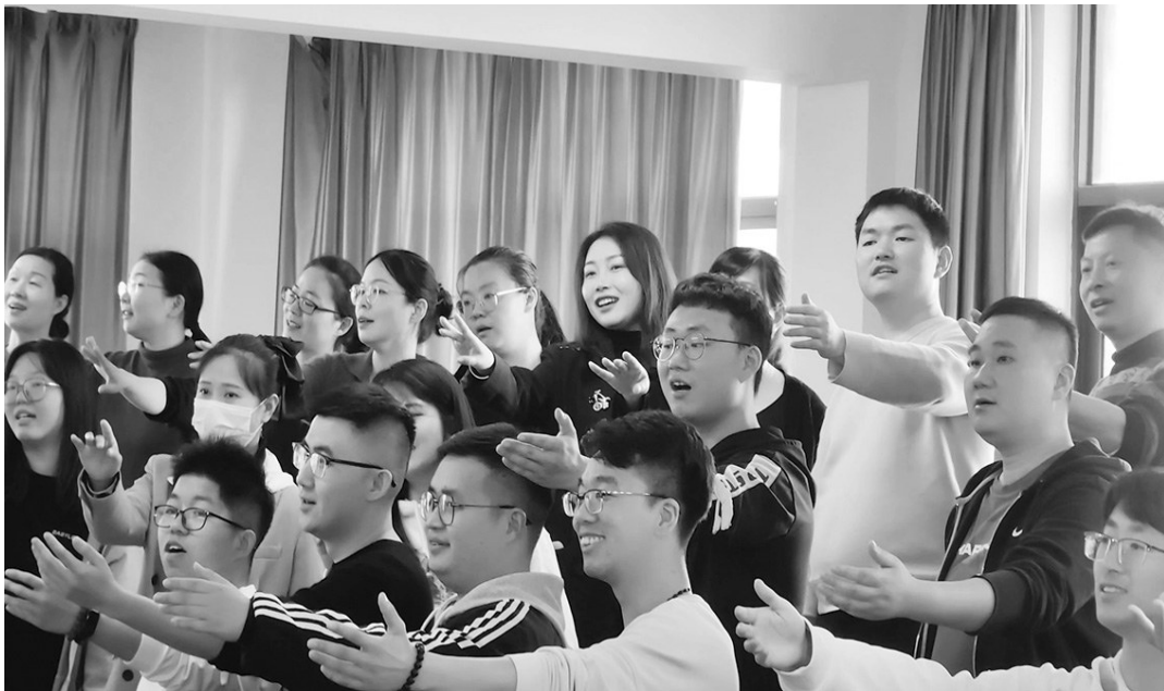
余姚市职工合唱团日常排练。

去年,凭借《汉阳门花园》这一曲目,余姚市职工合唱团获得第十六届中国国际合唱节金奖。中国国际合唱节,是目前我国举办的规模最大、规格最高的国际合唱艺术盛会。 相比于其他获奖的参赛者,