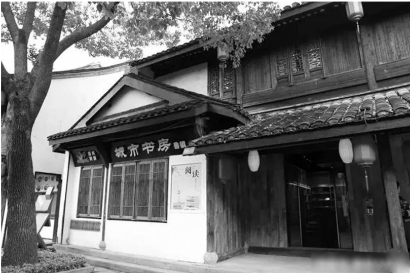
柯岩鲁镇城市书房