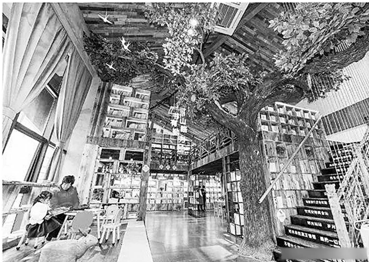
漓渚花溪老街城市书房