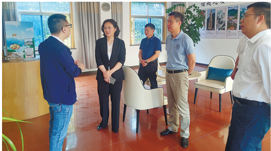
省总工会基层蹲点第五组蹲点调研定阳公路服务驿站“司机之家”。

喝口热水、吃口热饭、洗个热水澡、睡个安稳觉——对于常年奔波在路上的一千万货车司机来说, 在路上也能有个“家”, 是他们最关心最直接最现实的需求。