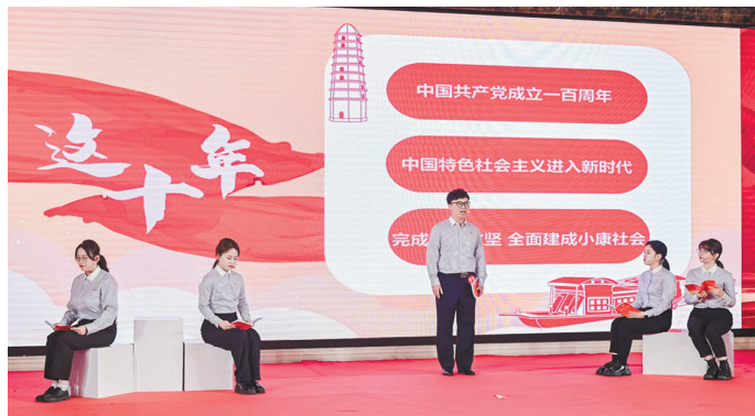
参赛职工动情诵读。

本报讯 记者程雪报道 昨日,“我心向党·踔厉奋进新征程”省财贸金融系统青年职工集体诵读比赛在杭州举办。省总工会党组成员、副主席吴海瑜出席比赛开幕式并致辞。