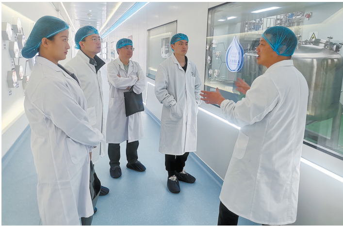
蹲点组成员在珀莱雅化妆品有限公司湖州分公司调研。

如今,吴兴区总工会构建的“心植工”“产改工福”和“产改指数”三大场景应用,已经投入使用。“心植工”涵盖了组织建设、工