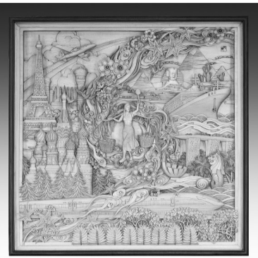
《货郎妹迈向新时代》