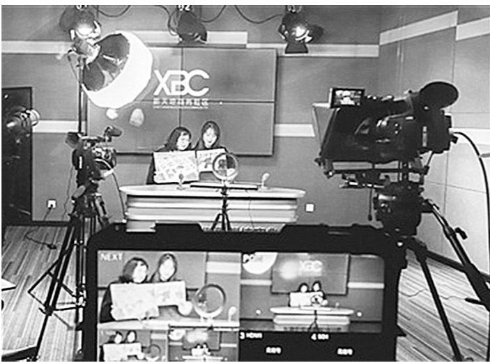
拱墅区新天地商务社区开设共享直播间,点对点地开展精准企业帮扶。

打造商务社区,“像服务居民一样服务企业”,是杭州市拱墅区今年优化营商环境创新探索出来的新模式。截至目前,拱墅区已成立16个商务社区,