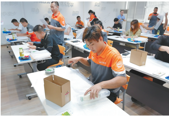
图为申丰快递公司工会举行的首届快递员技能竞赛现场。