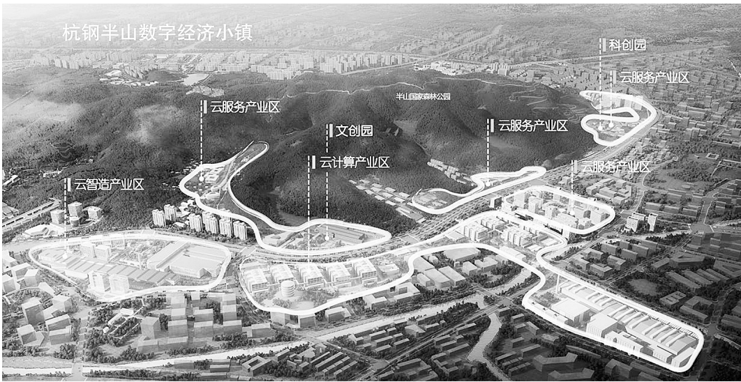
杭钢“一镇二园三区”数字经济小镇布局图

为此,杭钢集团以半山基地“一镇两园三区”产业空间布局为载体,加快半山基地数字经济小镇开发建设,完善半山基地产业链,进行多应用场景的延伸开发,努力把半山基地转型为数字经济发展核心区、先导区,打造杭钢集团独特竞