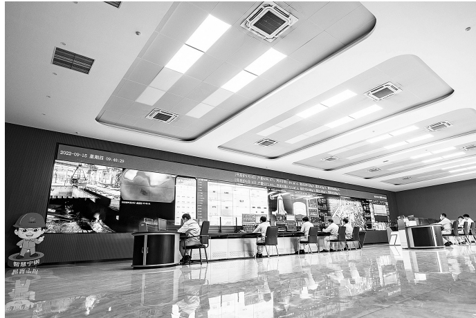
宁钢智慧高炉集控中心

一部杭钢史,半部杭城史。杭钢是浙江工业发展史的切片缩影,也是浙江工业“数字化”的开端之一。这座位于杭州半山、创立于1957年的杭钢有着诸多荣耀:优钢比达80%,