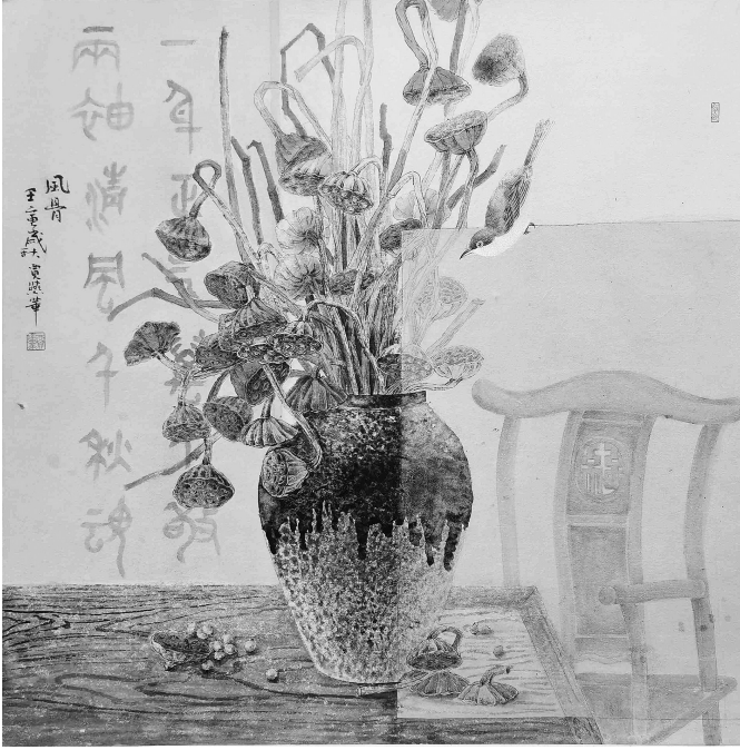
风骨 贾燕华 绘

其中,“职工翰墨书画”大赛共收到了372幅(组)作品,金华书画达人用笔墨描绘祖国河山壮美、人民幸福的美好景象,表达了热爱党、热爱祖国、热爱人民的赤诚情怀。前期通过专家初评,选取了80幅(组)作品进行了网络投票,最后综合评选出一等奖5件,二等奖10件,三等奖20件以及优秀奖、网络人气奖等。此次书画展展品均为荣获等级奖的作品,展出将持续一个月,有兴趣的职工朋友可以前往金华市工人大厦(双龙南街811号)一楼观展。