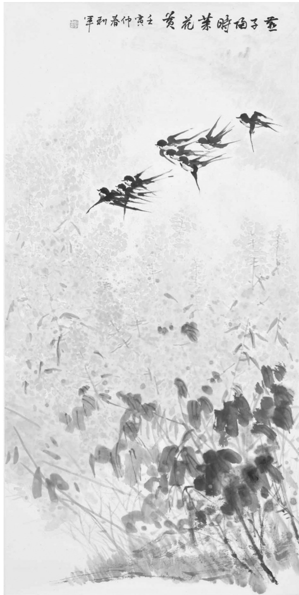
燕子来时菜花香 唐利军 绘