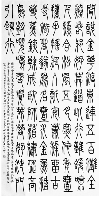
咏金华诗两首 何俊成 书