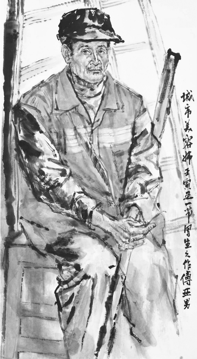
城市美容师 傅亚男 绘