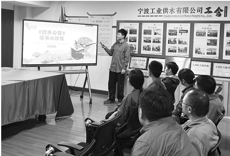
职工们正在参加读书小沙龙。

“参加微课堂活动,分享了《梦的解析》,为了达到满意的效果,我练了一次又一次,最后获得了大家的认可,很开心,重点是我在这个过程中提升了总结归纳和语言表达能力。同时,在换书环节中,我的书被一位同样喜欢心理学的同事领走,我又多了一位志同道合,