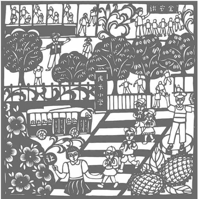
《高高兴兴上学,平平安安回家》钱禄萍