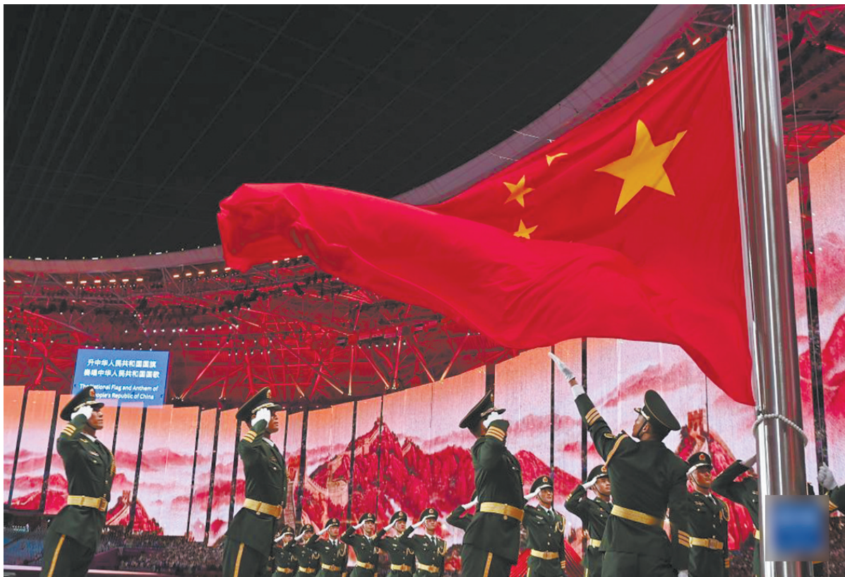
9月23日，第19届亚洲运动会开幕式在杭州举行，中华人民共和国国旗在开幕式上升起。

印度记者潘普克认为，杭州亚运会开幕式向亚洲和世界传递了科技和环保的理念。他说：“我们身处同一个世界，我们必须共同去保护这个世界。”