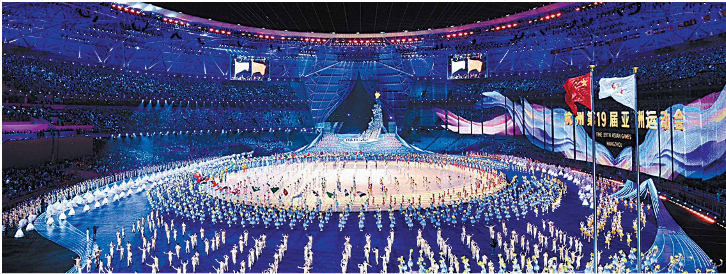
杭州第19届亚运会开幕。