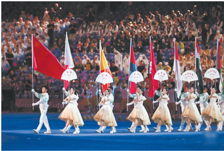
9月23日，各代表团旗手和礼仪志愿者在开幕式上入场。