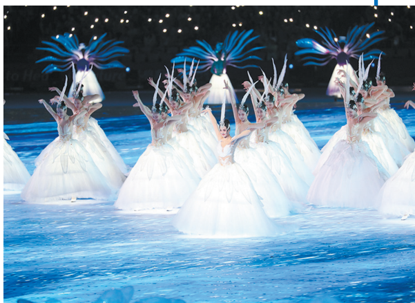
杭州亚运会开幕式精彩演出。