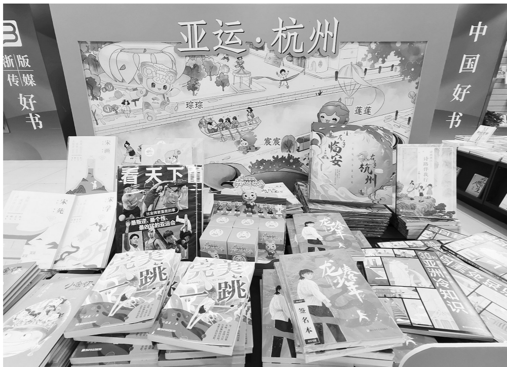
位于杭州中二路的中国好书书店二楼的亚运主题图书展示台。

手册分为“见证亚运”“喜迎亚运”“文明亚运”“中国亚运”“亚运简史”五大章节。“见证亚运”一章涵盖了杭州亚运会、亚残运会的相关内容,由杭州亚组委授权并提供相关原始文件;“喜迎亚运”展现了杭州、宁波、温州、湖州等11个设区市全情投入亚运会筹备工作的热烈氛围;“文明亚运”通过介绍相关文明礼仪规范,旨在让广大市民学礼仪、讲礼仪、用礼仪,不断增强“争做有礼市民、助力亚运盛会”的共识;“中国亚运”通过介绍北京亚运会和广州亚运会的相关情况,让市民更加直观地感受到几十年来祖国发生的翻天覆地的变化,从33年前举国之力办亚运,到如今以一省之力办亚运的巨大改变,从而增强广大市民的荣誉感、成就感;“亚运简史”通过介绍过去18届亚运会的基本情况,有助于增强市民对亚运会的了解和认识。