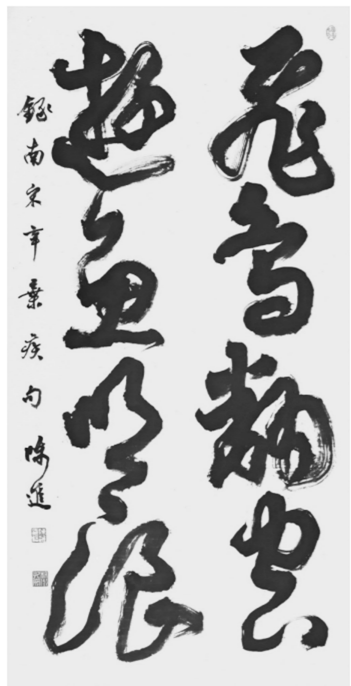
《飞鸟翻空 游鱼吹浪》(辛弃疾句)陈进书