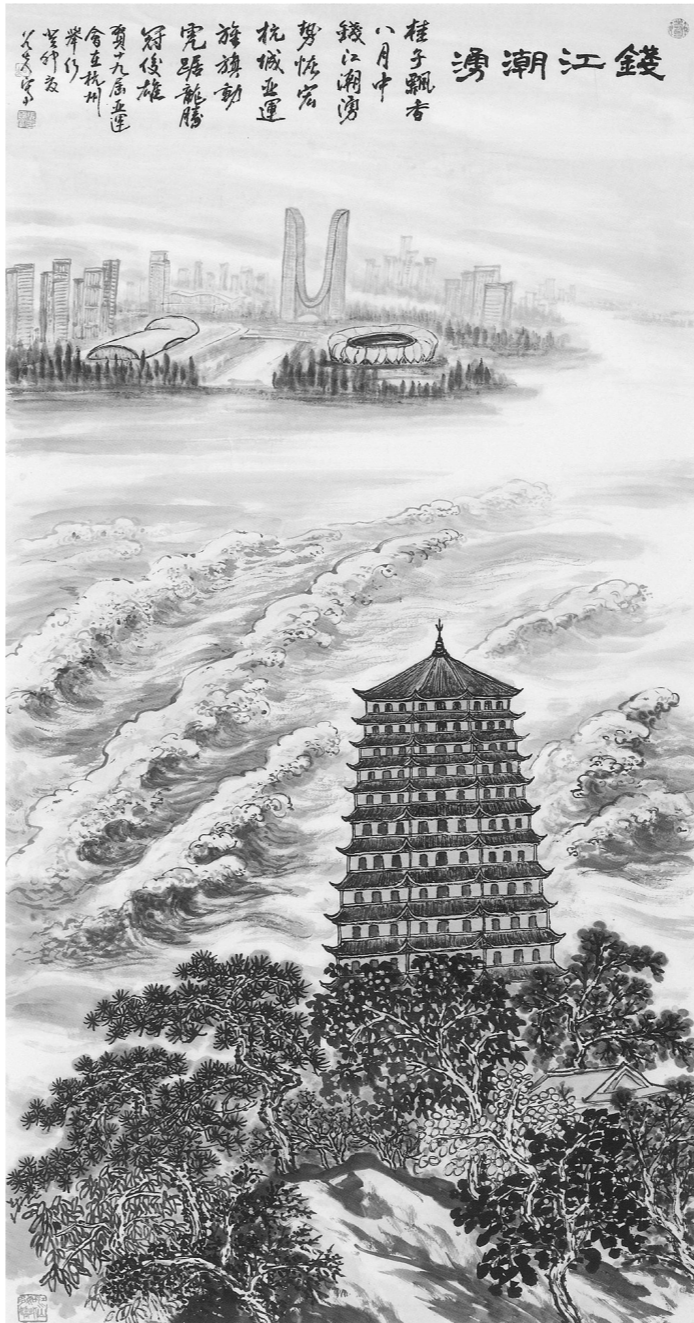
《钱江潮涌》张国富 绘