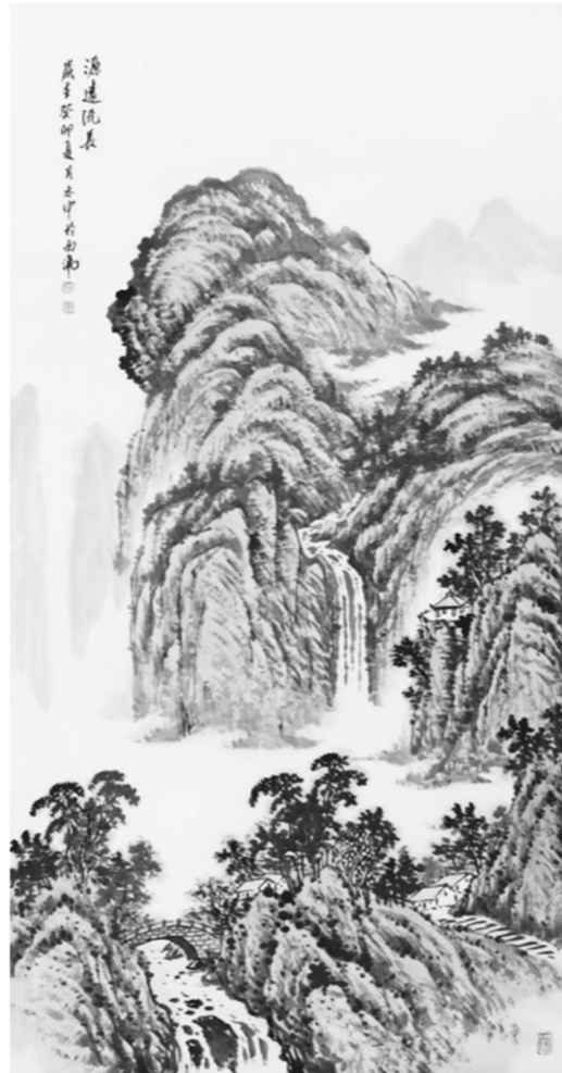
《源远流长》朱亦中 绘