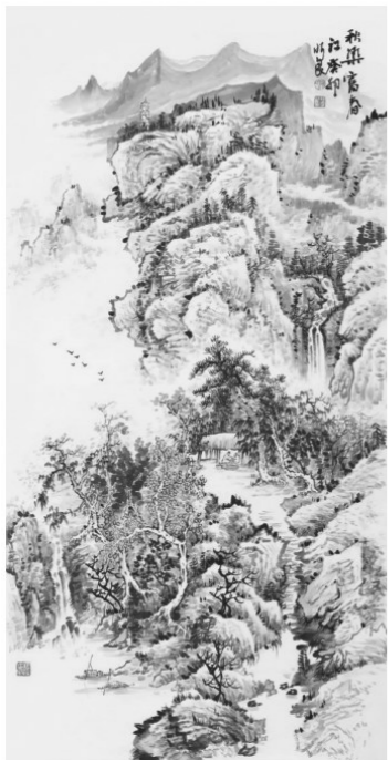
《秋染富春江》陈水良 绘

表达了他们对杭州举办亚运会的寸心敬意,为杭城增墨添彩。2023年10月是第14个“全国敬老月”。为了弘扬中华民族尊老、敬老的传统美德,营造和谐美好的氛围,同时预祝杭州亚运会圆满成功,现选登部分优秀书画作品,以飨读者。