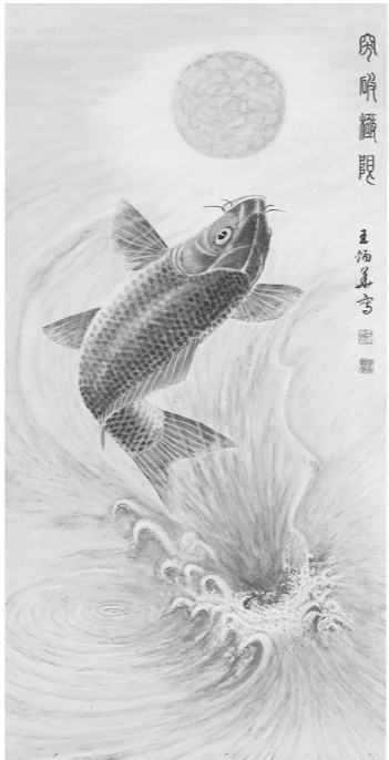
《突破极限》王炳华 绘