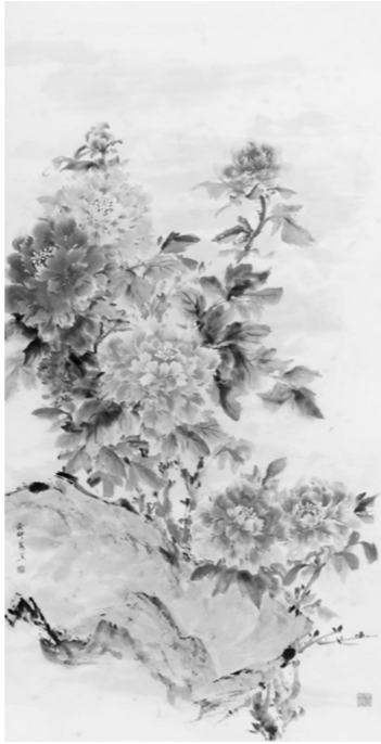
《花团锦簇》顾秀兰 绘