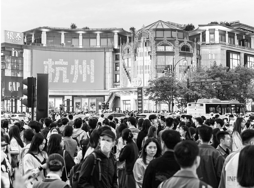
节假日期间人潮汹涌的杭州龙翔桥商圈。

“数字贸易 商通全球”是数贸会永恒的主题,也是时代殷切的呼声。第二届数贸会将以更高的站位、更广的视角,扩大开放、深化合作、引领创新。