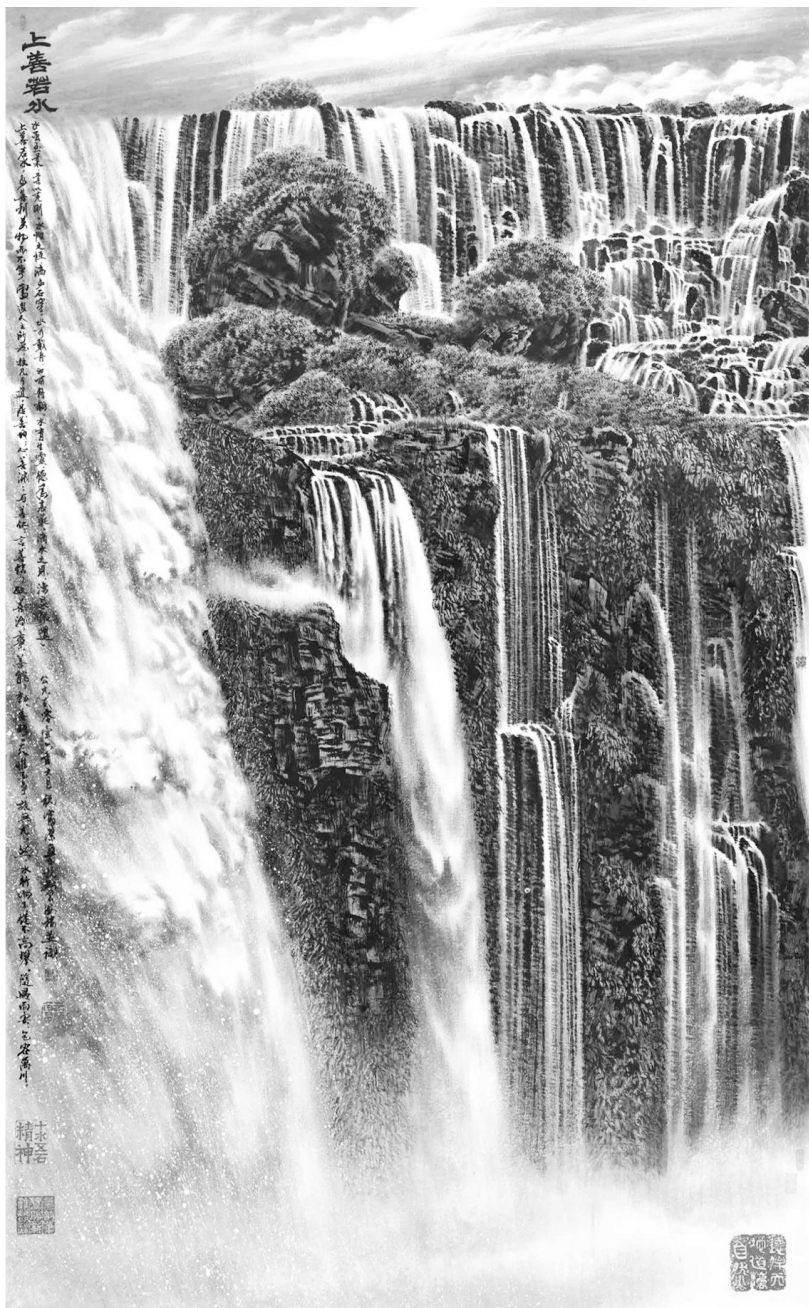
《上善若水》祝富荣 绘