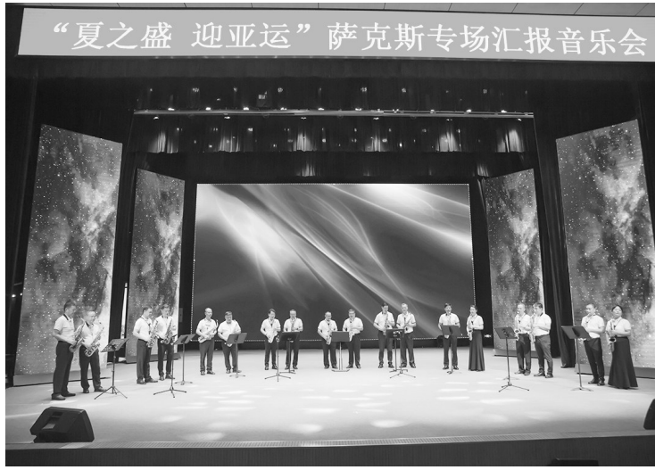
“夏之盛 迎亚运”萨克斯专场汇报音乐会。

“接单”后，整合在丽高校、艺术团体等优质师资，“配菜”“制菜”“上菜”完成“中央厨房”式文化服务。至今，已开发“宋风雅韵”“畲族风情”“体验非遗”等6大门类130多个纯公益的精品课程，全年分三期开设职工素养提升纯公益培训班400多个。