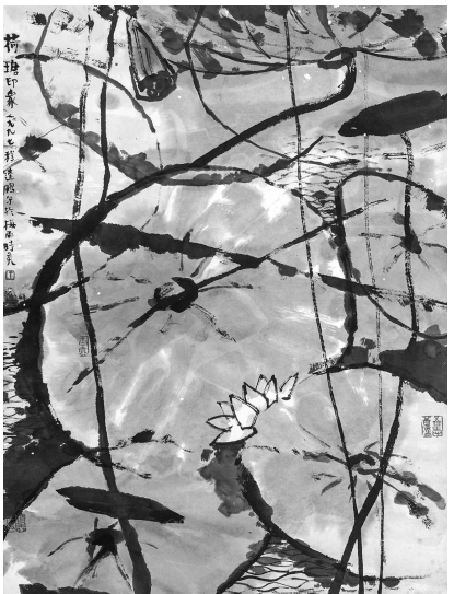
《荷塘印象》程连鹏 绘