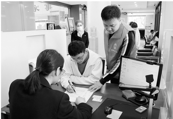
在临海农商银行,一名职工在工会工作人员的指导下办理“工薪贷”。

记者潘仙德报道 “我们外地职工,以前去银行贷款很不容易,现在有了‘工薪贷’,不用担保也不用抵押,比回老家贷款还方便。”浙江华海药业股份有限公司职工小程说。 据悉,临海市总工会在积