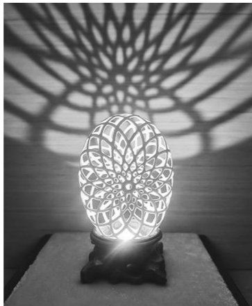
被更多人知晓、关注和喜爱。

后来，他又研究升级技艺，尝试不同飞禽类的蛋壳，从线刻、浮雕向点刻、镂空、透雕等雕刻方式转变，力图让蛋雕呈现更立体的视觉效果，并逐渐形成自己独特的风格。工成于人，执守匠心。杨德贵和他的蛋雕技艺，渐渐地