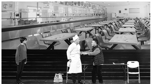
台州市总工会选送的小品《我是高工》