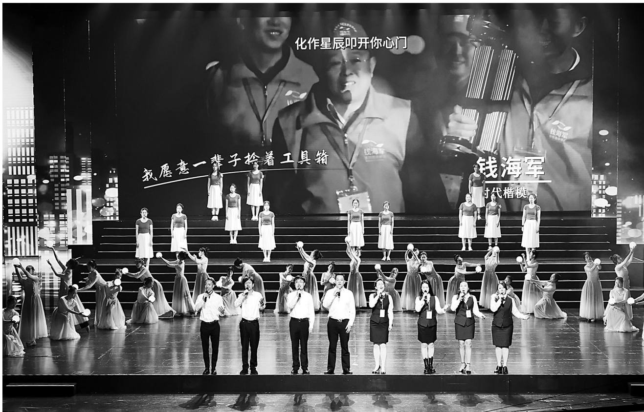
宁波市总工会选送的歌曲联唱《为你点灯》