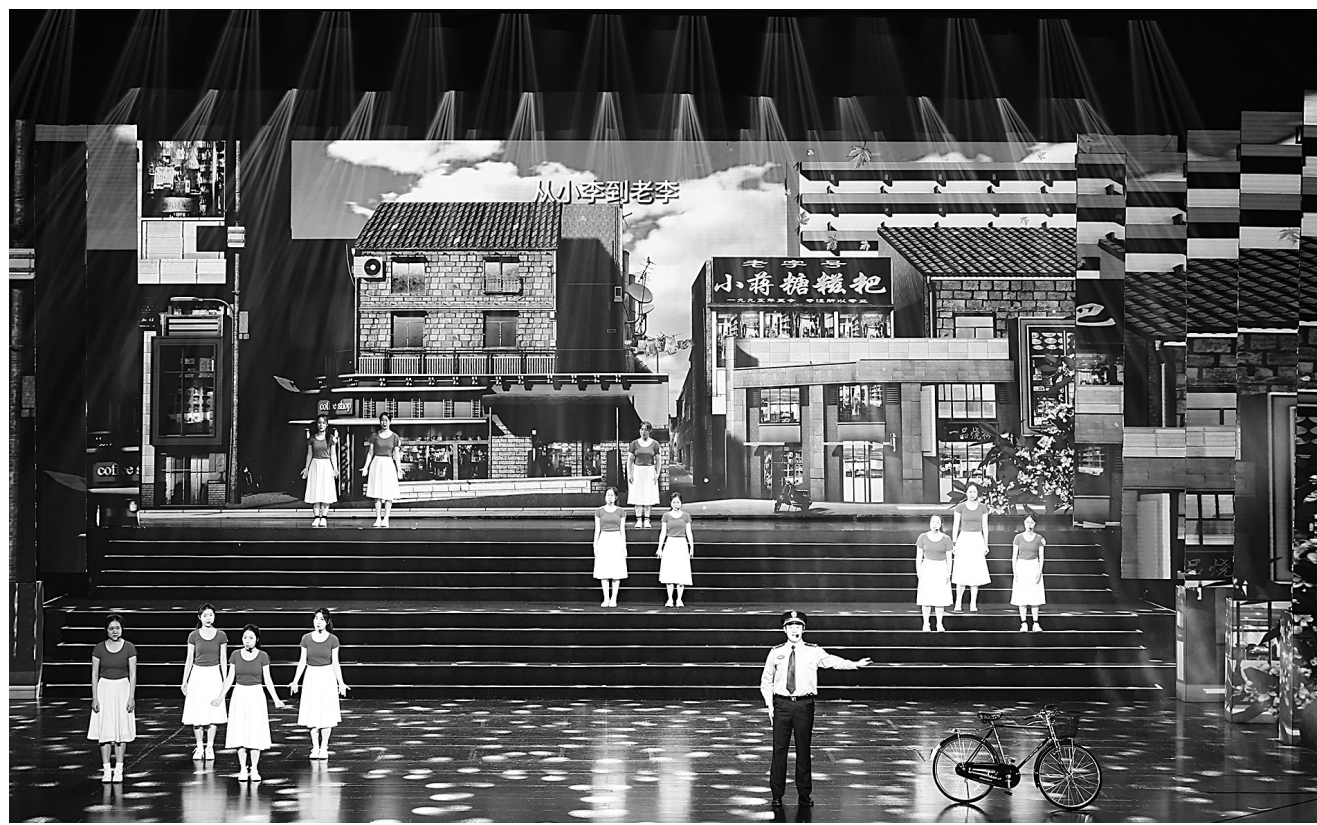
温州市总工会选送的歌曲联唱《从小李到老李》