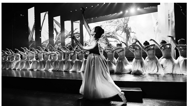
杭州市总工会选送的歌曲联唱《稻子开花》