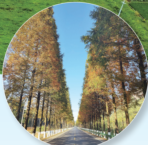
205国道k1852至k1853(峡口镇车干弄)路段