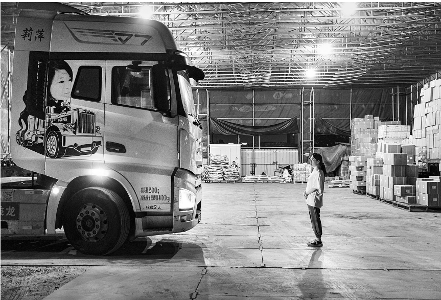
网红“卡姐”组照选登。