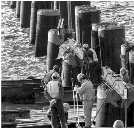
穿山港区国际集装箱泊位正扩建中(摄于2007年)。