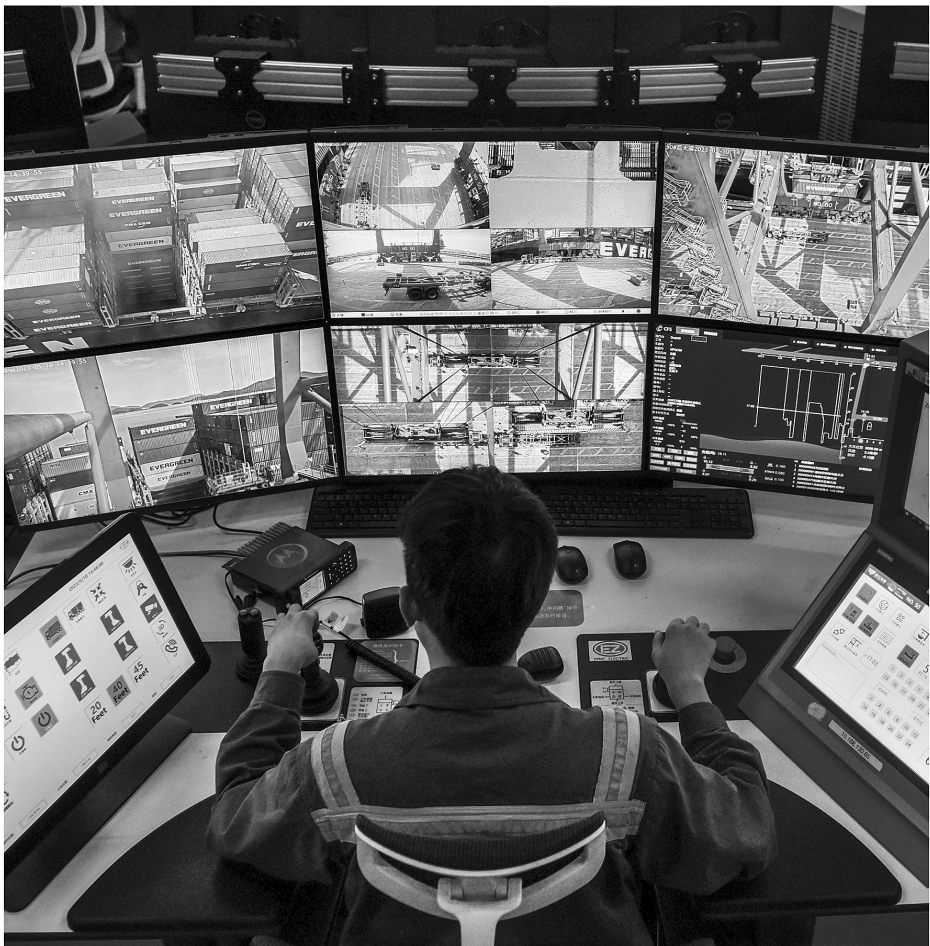
梅山港区实现全域桥吊远程数控操作(摄于2023年)。