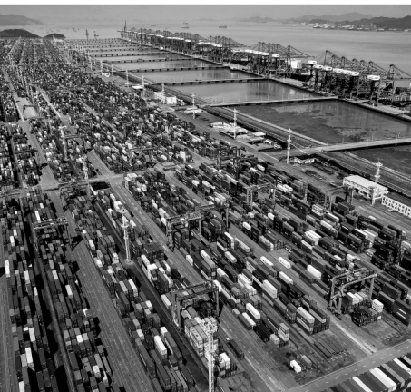
宁波舟山港货物吞吐量位居全球第一(摄于2023年)。