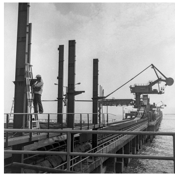
北仑港区一期工程矿石泊位即将竣工(摄于1985年)。