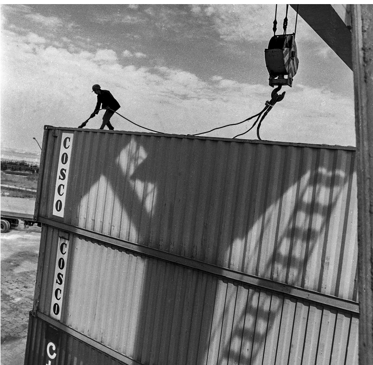
当年的集装箱装船,还需人工辅助(摄于1991年)。