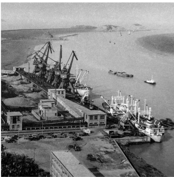
宁波港第一座万吨级煤炭码头建成(摄于1982年)。