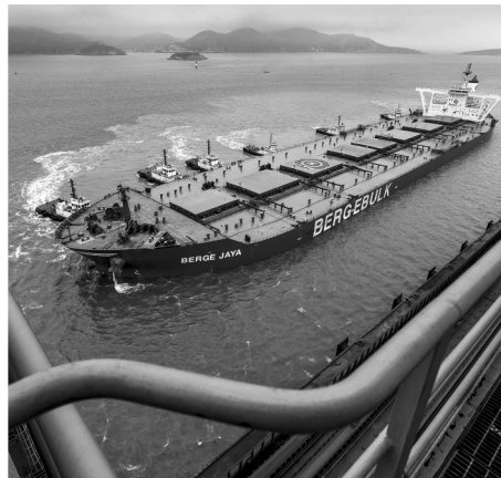
当时全球最大的巨轮靠泊鼠浪湖港区(摄于2017年)。