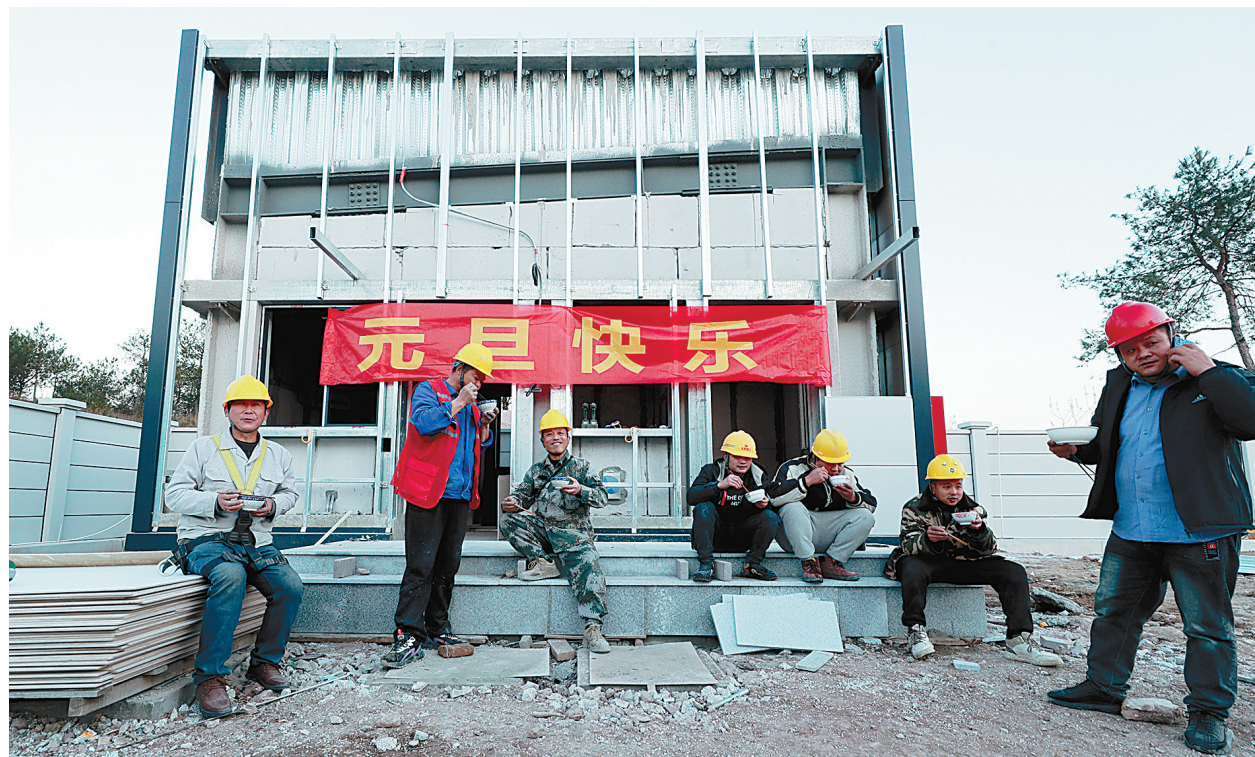
施工人员席地而坐吃水饺。