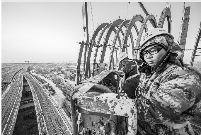
《杭州西站建设者》(组照选登)