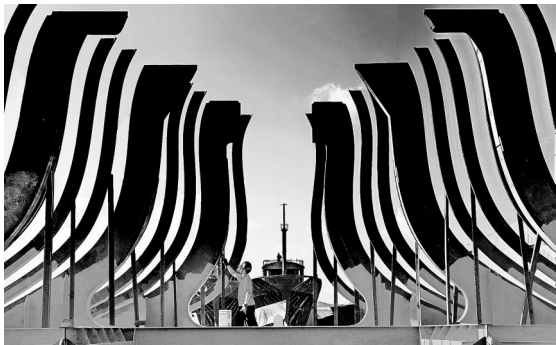
《船体钢构》(组照选登)