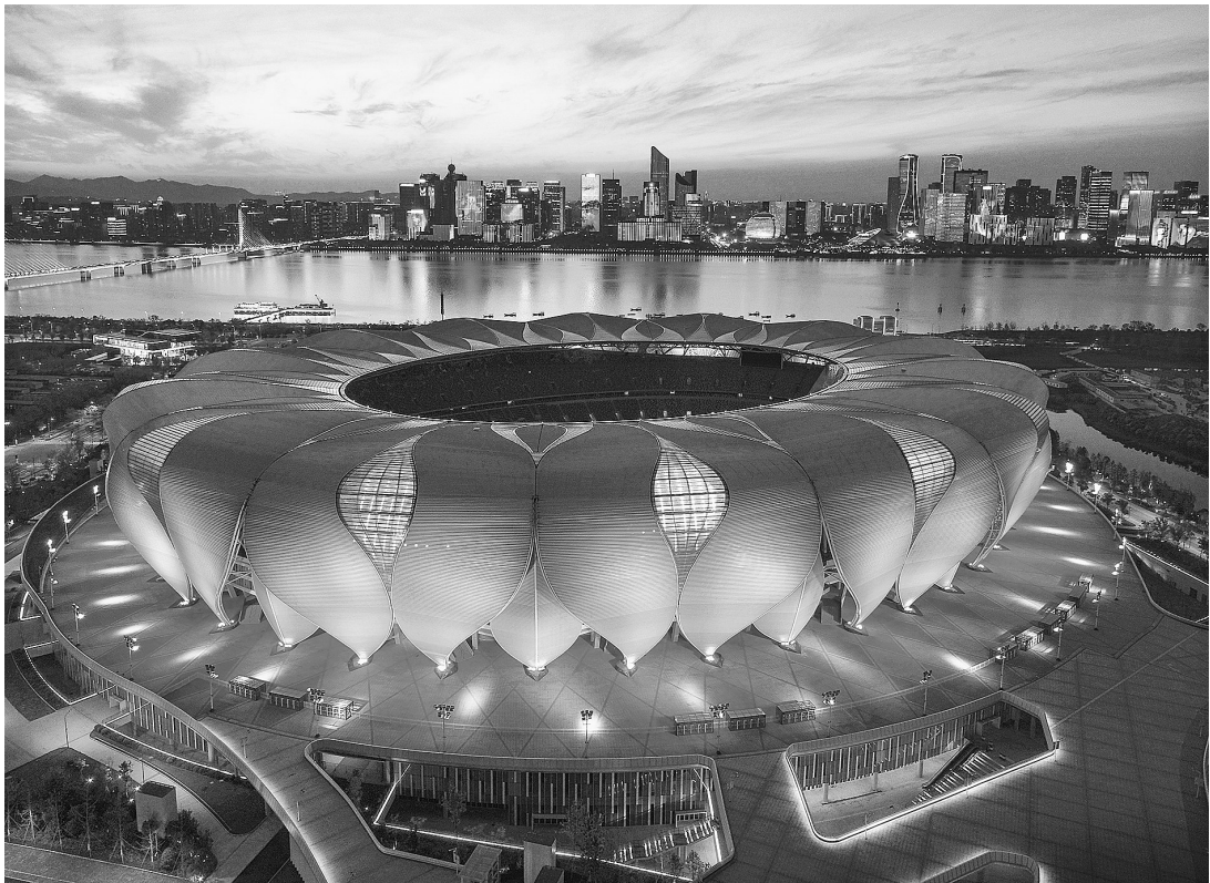
《亚运场馆定妆照》(组照选登)