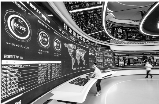
《数字工厂》