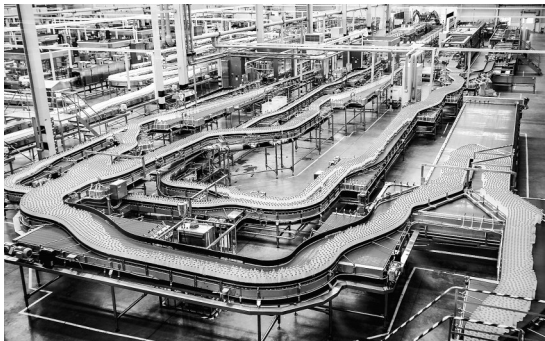
《农夫山泉生产线》