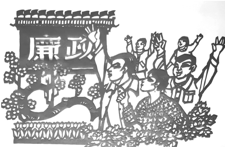
廉政 通讯员沈光祖 作

依偎新年的台历 就像背靠一座温暖的小山 呼吸春天的气息 重温 and 点燃生活的梦境