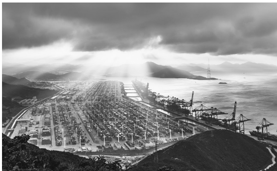
《东方大港》