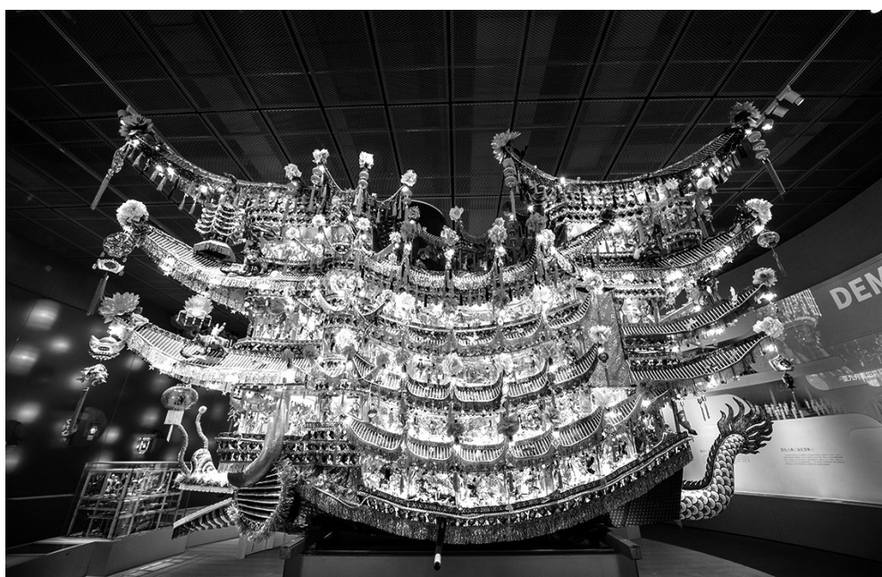
乐清灯彩首饰龙。

后,龙灯队最后会来到村中心的广场上,继续作精彩的表演。此时的龙灯,在欢快的锣鼓声中,忽左忽右、忽上忽下;前扑后翻,翻腾跳跃,时而如蛟龙出海,时而似游龙出水,时而又像飞龙扑珠,不断变幻出花样翻新的动作。最后,直至龙身盘曲,龙头顿点,才预示着整场表演圆满结束。