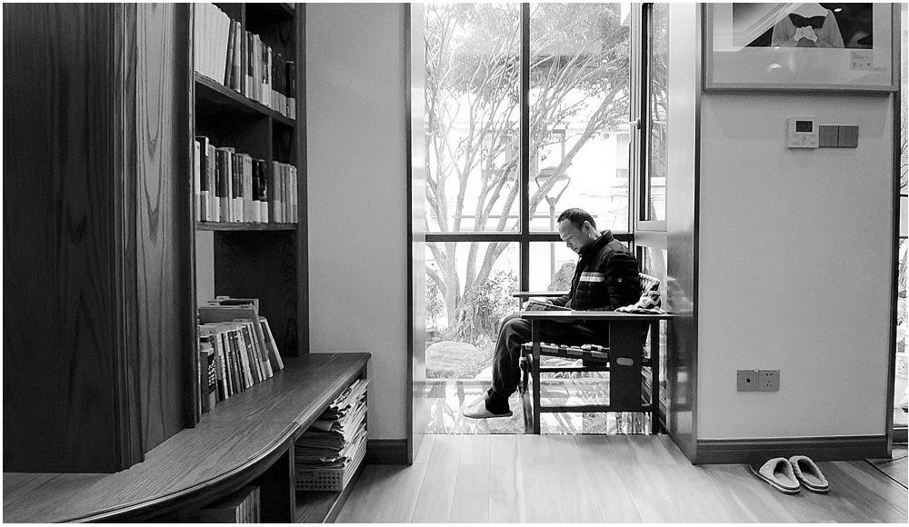
居民在“共享书屋”静静阅读。

笔者在书屋的书籍分类管理明细表中看到,所有的书籍都按照摆放位置进行分类,每本书籍都详细标注,有编