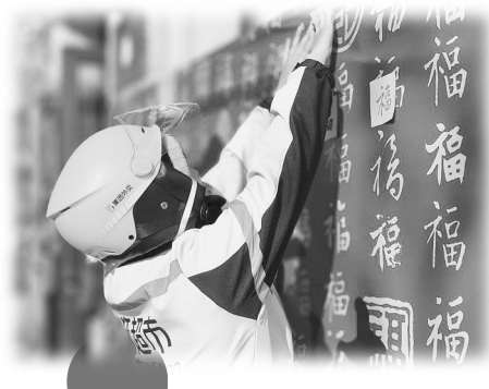
迎“新”纳福