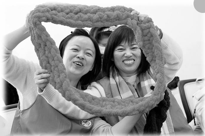
编织温暖