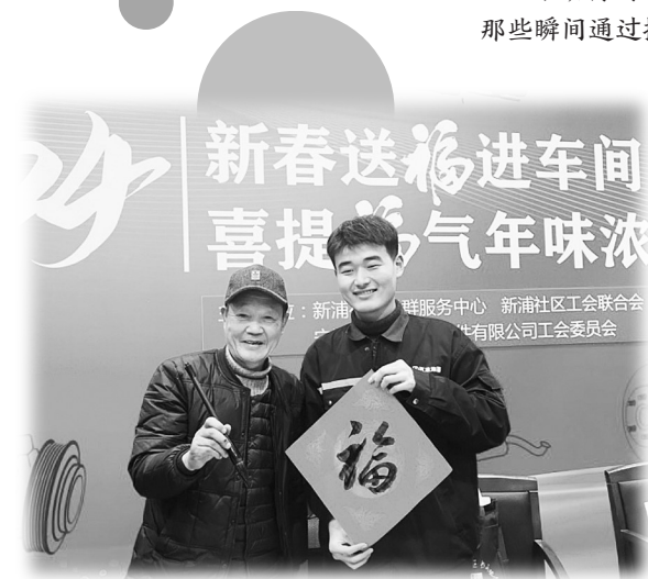
新春送福进车间

日前,宁波市总工会邀请专家,对征集到的所有作品进行评审,评选出50份优秀摄影作品、60篇优秀征文等。现分享部分获奖作品,一起感受“娘家人”带来的温暖和美好。