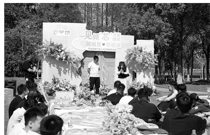
单身职工在迪荡湖边浪漫相聚。

本报讯 记者胡坤 通讯员秦师余报道 一见倾“芯”,才聚越城。日前,来自绍兴越城区集成电路产业、区直机关(单位)、区教育局、区卫健系统的40位优质单身职工浪漫相聚在绍兴人才之家,参加集成电路产业人才专场联谊活动。