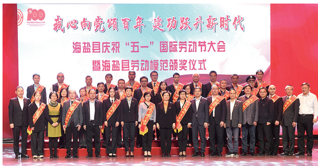
庆祝“五一”国际劳动节大会暨劳动模范颁奖仪式