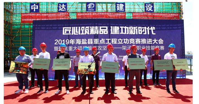
重点工程立功竞赛推进会暨“聚焦重大项目推进攻坚战”架子工职业技能竞赛

和谐稳定的职工队伍对发展新质生产力同样重要，海盐县总工会充分发挥工资集体协商在助力“扩中提低”收入分配重大改革的积极作用，实现全县产改试点单位能级工资集体协商覆盖率100%，在快递、电商、外卖、货运等新业态重点行业领域实现能级工资集体协商全覆盖。五年来，能级工资集体协商覆盖企业329家，惠及职