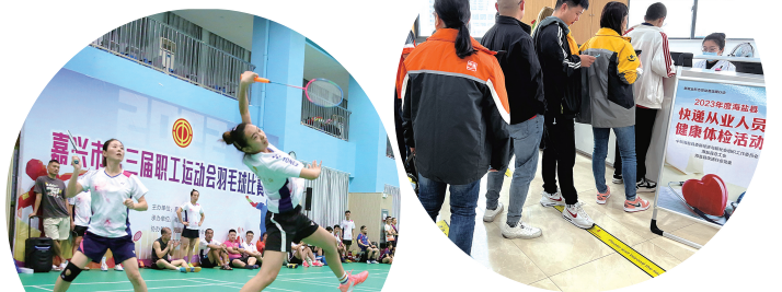
组织全县快递从业人员免费健康体检