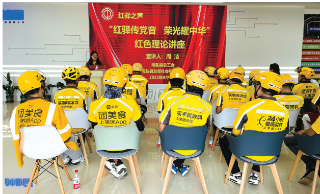
“红驿传声” 荣光耀中华”红色理论讲座

五载铸魂红，工会党旗扬。海盐县总工会始终坚持党对工会的全面领导，不断开展“红船精神进企业”暨党史学习教育巡回宣讲、企业青年理论宣讲大赛暨微型党课大赛、“党建红·党的二十大精神进驿站”、“守好红色根脉·班前十分钟活动”等红色教育活动，每一项活动都旨在将红色基因深深植入每一位工会成员的心中，引领广大职工群众听党话、跟党走。五年来，县总工会共组织各类示范宣讲500余场次，覆盖职工群众10万余人次。