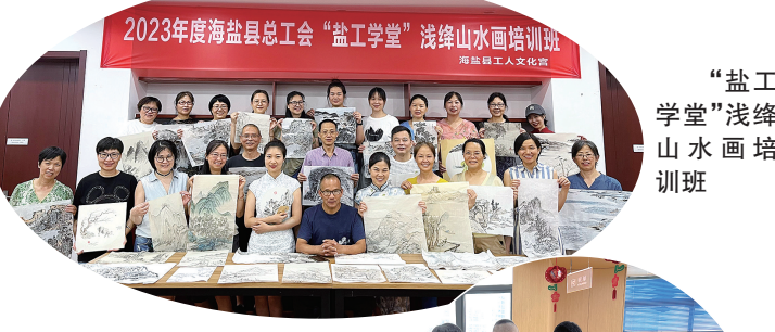
“盐工学堂”浅绛山水画培训班