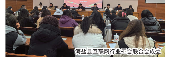
海盐县互联网行业工会联合会成立

总工会始终紧盯培养适应时代要求的高素质工会干部目标，结合新时期工会工作新特点、新要求，坚持精心筹划、分类施教、提质扩面，多渠道多领域拓展提升工会干部能力水平。每年组织开展全县工会干部培训，不断提升强化工会干部担当意识、履职