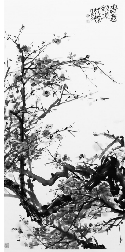
《春意初浓》 程素良 绘