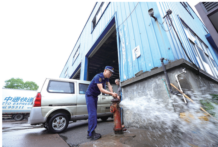
图为消防监督员检查消防设施。

“一年一度‘618’电商消费大促活动即将来临,物流、快递行业也将迎来配送高峰期,消防安全不容忽视。”衢州开发区消防救援大队相关负责人表示,他们将重点对物流快递公司的消火栓、灭火器、应急照明灯、疏散指示标识等设施配置情况,以及安全通道是否畅通、电器线路敷设、电动自行车是否违规停放充电等进行检查。同时,还对仓库存储货物情况、消防安全管理、值班巡查措施等进行细致了解,现场抽查了部分仓管员、快递小哥对灭火器掌握情况,并进行了消防安全宣传教育培训,进一步提高企业员工消防安全意识。