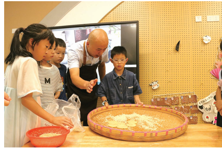
近日，在衢州市衢江区育才幼儿园欢乐苑分园，爱心托班里的孩子们欢乐体验衢州市非遗产品——桂花饼制作。在非遗传承人

的指导下，孩子们完成了从搓面团、塞馅料、封口、到面饼压扁、粘白芝麻等步骤，成功制作出了半成品。