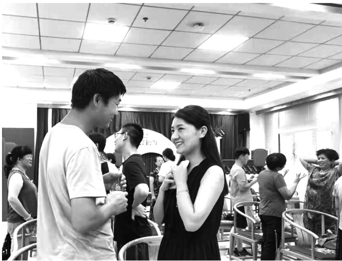
活动现场，畅所欲言。