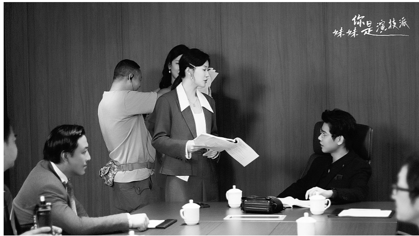
十七创作的短剧在拍摄中。