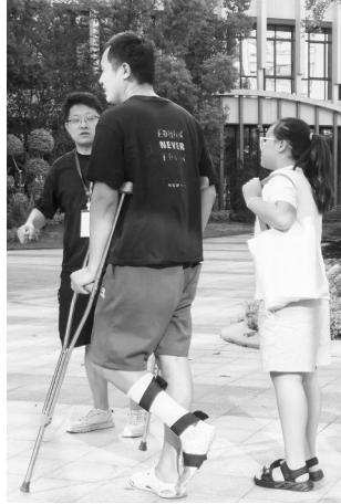
一名脚部受伤的考生在女儿陪伴下赴考。